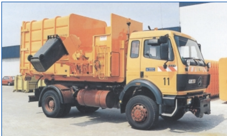
Seitenlader in Verbindung mit einem SPB

Der Seitenlader wird entweder direkt vom Fahrzeug über die Fahrzeughydraulik betrieben oder mit Zusatzeinrichtung im stationären Betrieb über einen Elektro-Hydraulik-Antrieb eingesetzt.