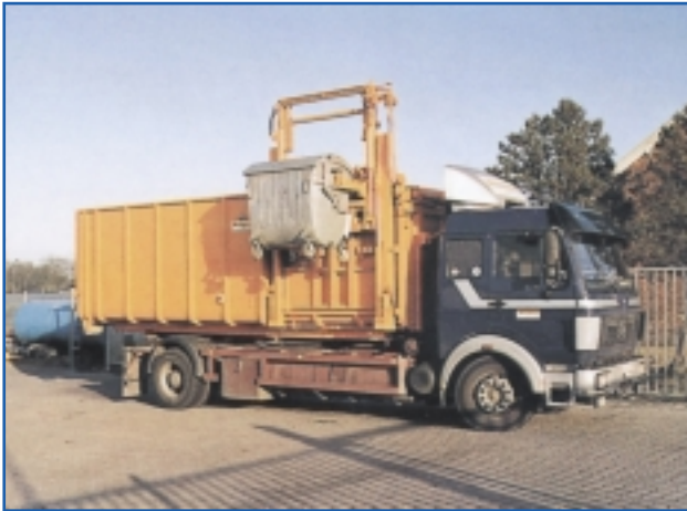
Großraumbehälter mit Seitenlader für 1,1 cbm-Behälter