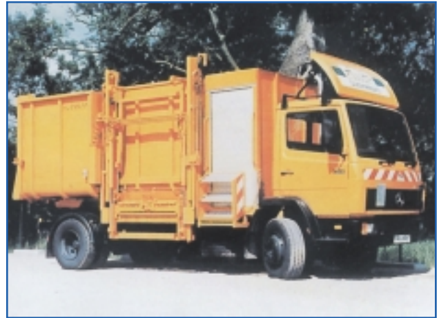
Umleermobil für mineralölhaltige Feststoffe